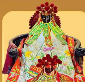
เจ้าแม่กวนอิมสองขำ