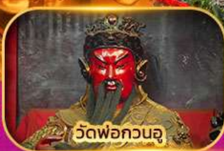
วัดพ่อกวนอู