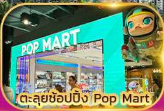
ตะลุยช้อปปิ้ง Pop Mart