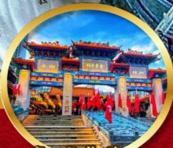
วัดหวังต้าเซียน ขอพรด้านสุขภาพ