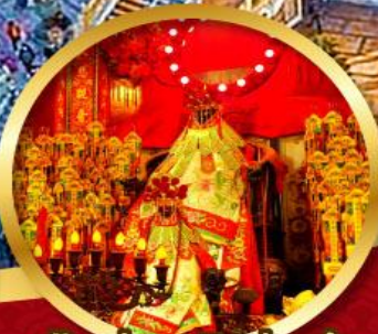
เจ้าแม่กวนอิมอ้ออ่า นมัสการองค์เจ้าแม่กวนอิม อายุกว่า 600 ปี