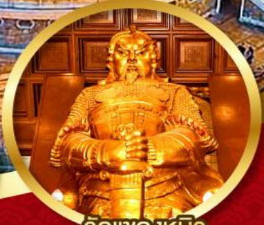
วัดเข่งหีบิว ขอพรโชคกลาง การเงิน และ ธุรกิจ