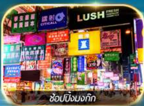
ช้อปปิ้งมงก๊ก

เต็มอิ่มทั้งบุญ และ ช้อปปังแบบจัดเต็ม จิมซาจุ่ย มงก๊ก