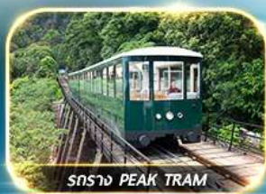
สายรถ PEAK TRAM