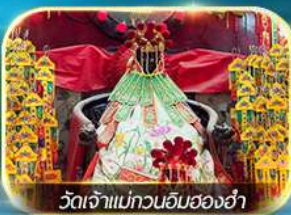
วัดเจ้าแม่ทวนอิมของฮ่า