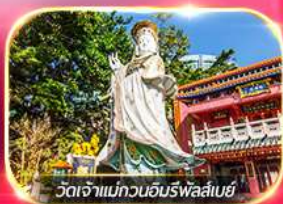
วัดเจ้าแม่กวนอิมพรอสเปอ