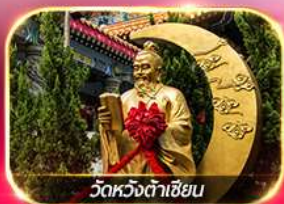
วัดหวงต้าเซียน