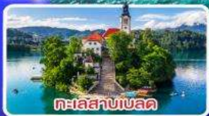
ทะเลสาบเบลลด์

ไข่มุกแห่งอาเดรียติก พร้อมขึ้นกระเช้า SRD