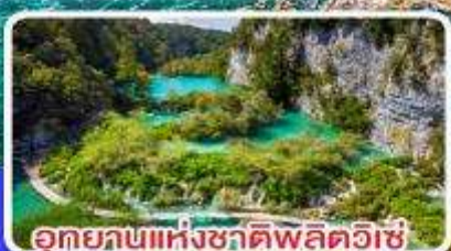
อุทยานแห่งชาติพลิตวิเช่