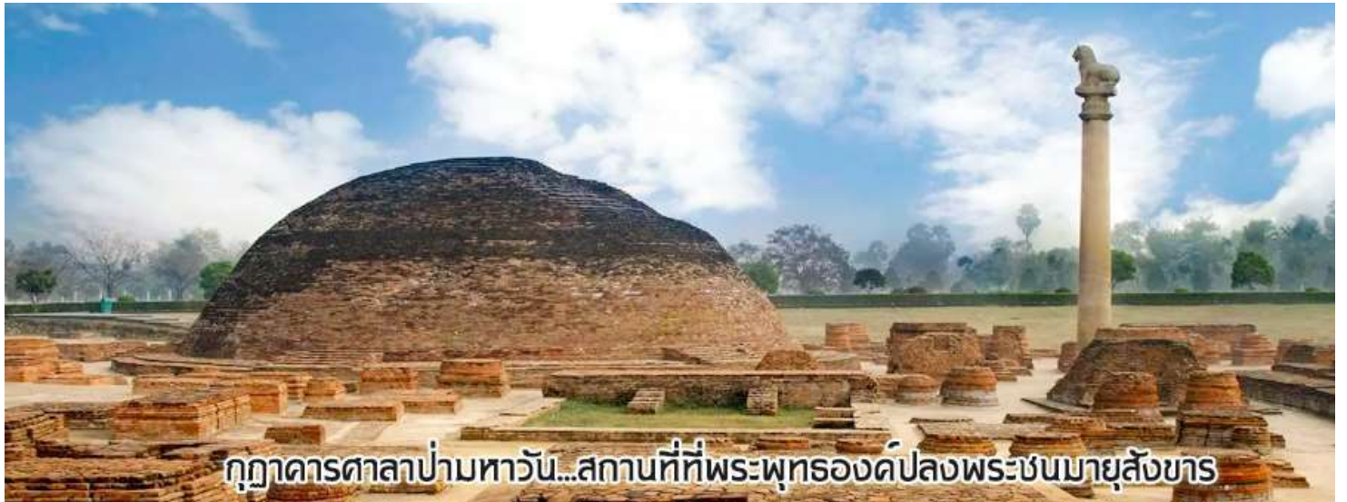
กุฎาคารศาลาป่ามหารวัน...สถานที่ที่พระพุทธองค์ปลงพระชนมายุสังขาร

นำท่านเดินทางต่อสู่เมือง กุสินารา (เดินทางประมาณ 4 ชั่วโมง)เมื่อถึงกุสินาราแล้วเดินทางไป วัดไทยกุสินาราเฉลิมราชย์ วัดนี้สร้างขึ้นเพื่อน้อมเป็นพุทธบูชาและเฉลิมพระเกียรติพระบาทสมเด็จพระเจ้าอยู่หัวในวาระครองสิริราชสมบัติครบ 50 ปี และเฉลิมพระชนมพรรษาครบ 6 รอบ 72 พรรษา พระบาทสมเด็จพระเจ้าอยู่หัวพระราชทานชื่อวัดให้ เชิญท่านร่วมทำบุญตามกำลังศรัทธา