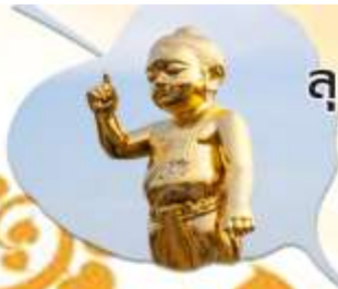
ลุมพินี สถานที่ประสูติ