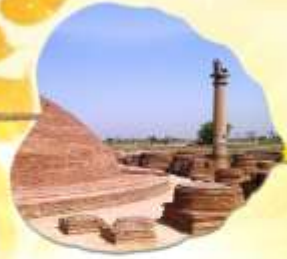
เมืองหลวงแคว้นอานาจักรวัชชี แคว้นชมพูทวีป