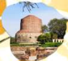
กุสินารา สถานที่ปรินิพพาน