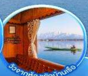
สวนโมกุล เมืองศรีนาคา