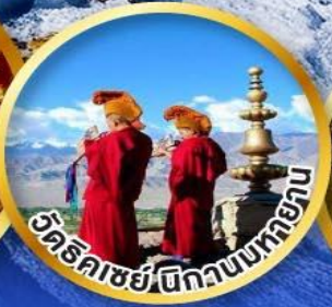
วัดธิคเซย์ตีกวานบเทยาน