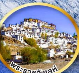
พระราชวังเลห์