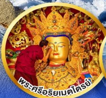
พระศรีอริยเมตไตรย์