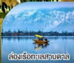
ล่องเรือทะเลสาบคาล