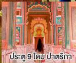
ประตู 9 โดม ปาตริกา