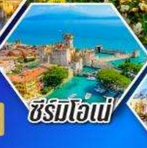
ซีร์มิโอนี