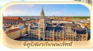
จัตุรัสมาเรียนพลัทซ์