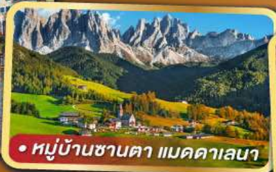
• หมู่บ้านซานตา แมดดาเลนา