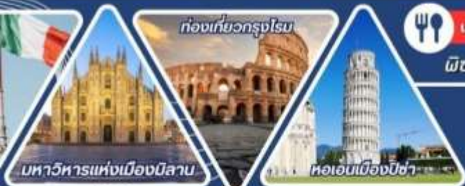
มหาวิหารแห่งเมืองมิลาน

นั่งรถไฟเที่ยวซิงเคเวเทอร์ เที่ยวเกาะเวนิส หอเอนพิซ่า ใน 7 สิ่งมหัศจรรย์