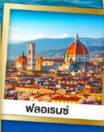
ฟลอเรนซ์