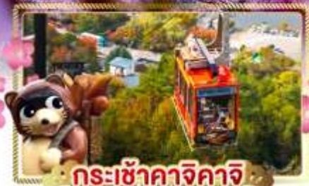
กระเช้าคางิจิกาจิ