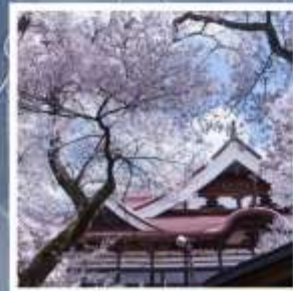
สวนสาธารณะซากุระปราสาทคาคาโตะ