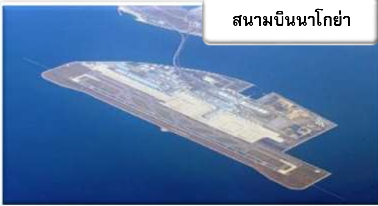
สนามบินนาโกย่า

เวลา 00.05 น. ออกเดินทางสู่ สนามบินนาโกย่า ประเทศญี่ปุ่น โดยสายการบินไทยแอร์เวย์ เที่ยวบินที่ TG 644