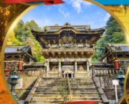
ศาลเจ้านิกโกโทโกโช