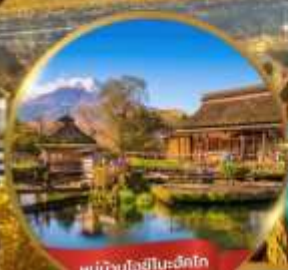
หมู่บ้านโอชิโนะะงักโก