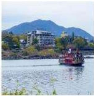
ล่องเรืออปปะระะ