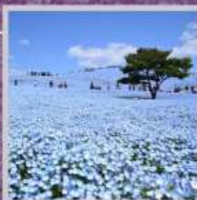
"HITACHI SEASIDE PARK"