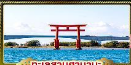
ทะเลสาบฮามานะ