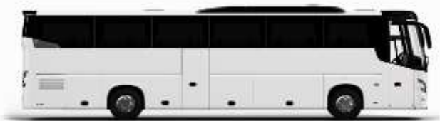
ตัวอย่างรถโดยสาร 1 คัน

ค่าที่พักตามที่ระบุในรายการหรือเทียบเท่าระดับเดียวกัน (พิกห้องละ 2 ท่าน) หากประเภทห้องที่ท่านริเวสมาเป็นเช่นจาก เช่น ริเวสห้องพักเป็น TWIN BED หรือ DOUBLE BED ทางบริษัทขอสงวนสิทธิ์ในการปรับประเภทห้องพัก เป็นตามที่โรงแรมมีอยู่ โดยไม่ต้องแจ้งให้ทราบล่วงหน้า