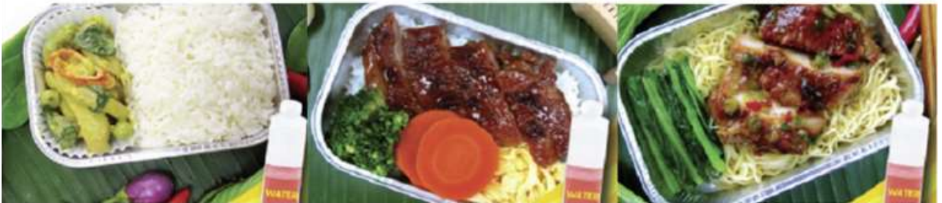
Chicken roasted with herb and noodle and water