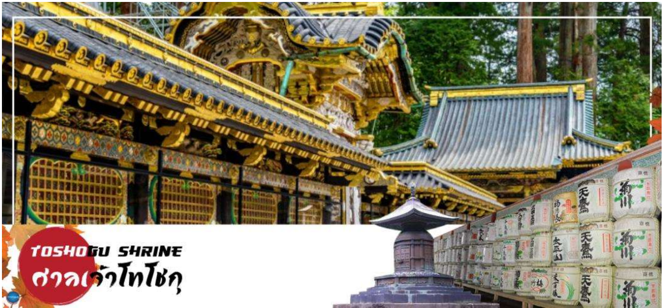
TOSHOGU SHRINE ศาลเจ้าโทโชกุ

เมืองนิกโกะ – ผ่านชม สะพานชินเคียว – ศาลเจ้าโทโชกุ – ศาลเจ้าฟูตาระ – จังหวัดไซตามะ – ย่านเมืองเก่าคาวะโกเอะ – ตระกูลกวางด – เมืองยามานาชิ – ออนเซ็น + ชาบูยักษ์