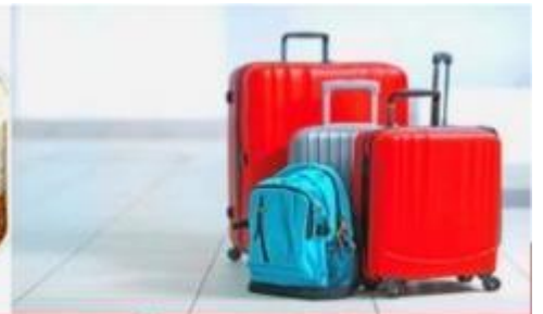
น้ำหนักกระเป๋า สูงสุด 20 กก.