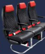
**เมื่อราคาทุกครั้งที่ก่อนทำการสั่งซื้อ

HOT Seat ด้วยพื้นที่กว้างที่กว้าง 17.5 นิ้ว คุณจึงมีพื้นที่กว้างขึ้นสำหรับการยืดขาได้อย่างเต็มที่ นอกจากนี้คุณยังจะได้สิทธิขึ้นเครื่องก่อนใครอีกด้วย