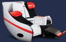
**อวิชั่น ณ วันที่ 26/02/67**

Premium Flatbed ที่นั่งสุดพิเศษขนาดที่นั่งกว้าง 19 นิ้ว ที่มีความห่างระหว่างแถว 59 นิ้ว สามารถปรับนอนได้เท่าที่คนต้องการ พร้อมด้วยอุปกรณ์อื่นๆ ให้คุณเดินทางอย่างสะดวกสบายเต็มที่