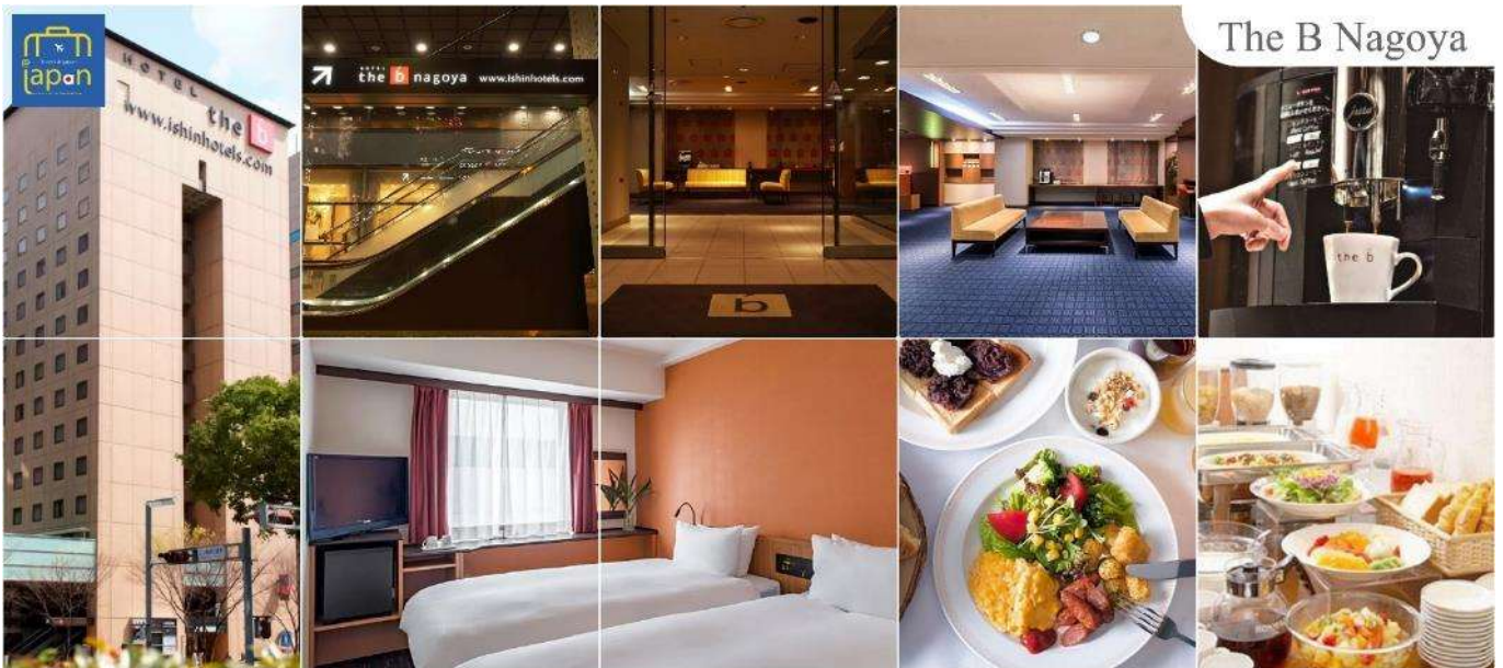
The B Nagoya

พักที่ HOTEL THE B NAGOYA หรือเทียบเท่าระดับเดียวกัน