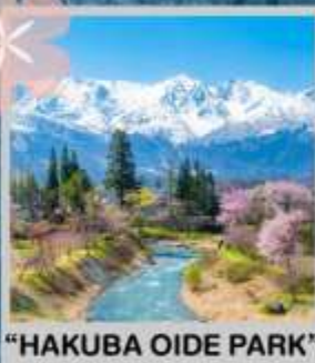
"HAKUBA OIDE PARK"