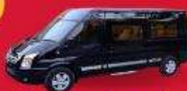
VAN (7-8 ท่าน)