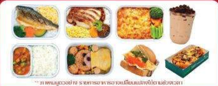
** ภาพเมนูตัวอย่าง รายการอาหารอาจเปลี่ยนแปลงได้ตามช่วงเวลา