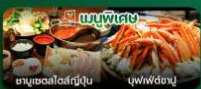
เมนูพิเศษ ชาบูสเตอโรลญี่ปุ่น บุฟเฟ่ต์ชาบู

วัดอาซากุสะ-ถนนนากามิเซะ-พิพิธภัณฑ์แผ่นดินไหว-ไร่ชาโอบุจิ ชะชะบะ-ไดเวอร์ซิตี โอไดบะ-ตลาดปลาซึกิจิ