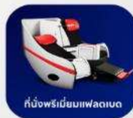
ที่นั่งพรีเมียมฟลายเบด