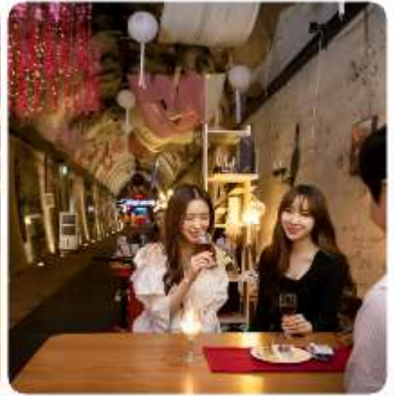
ตามใจชอบ

ถ้าไวน์แห่งกิมแฮ ราชบีเบอร์รี่พันธุ์ที่ถูกคัดสรรมาอย่างดี ผลิตผลทางการเกษตรที่ออกงามอย่างสมบูรณ์ในภูมิภาคประเทศ และภูมิภาคอากาศของกิมแฮ วัตถุประสงค์ตั้งต้นสุดพิเศษ เพื่อนำมาผลิตเป็นไวน์ชั้นเลิศ... กับสถานที่หมักไวน์ที่ไม่เหมือนที่ใดในโลก นั่นคืออุโมงค์แซงนิม อุโมงค์รถไฟที่ถูกทิ้งร้าง ถูกบูรณะและสร้างเป็นที่บ่มและเก็บไวน์ตลอดความยาว 215 เมตรของอุโมงค์แห่งนี้ ถูกตกแต่งและจัดสรรเป็นพื้นที่แห่งความสุข โดยมีทั้งหมู่บ้านสตอรี่ของเบอร์รี่ มาสคอตของอุโมงค์แห่งนี้ ที่เป็นเหมือนสวนสนุกเล็ก ๆ และพร้อมด้วยร้านจำหน่ายไวน์ราชบีเบอร์รี่ และไวน์อีกหลากหลายชนิดมีไว้ให้ชิม และเลือกสรร