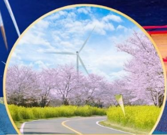
ซากระะ / ทุ่งดอกเรป