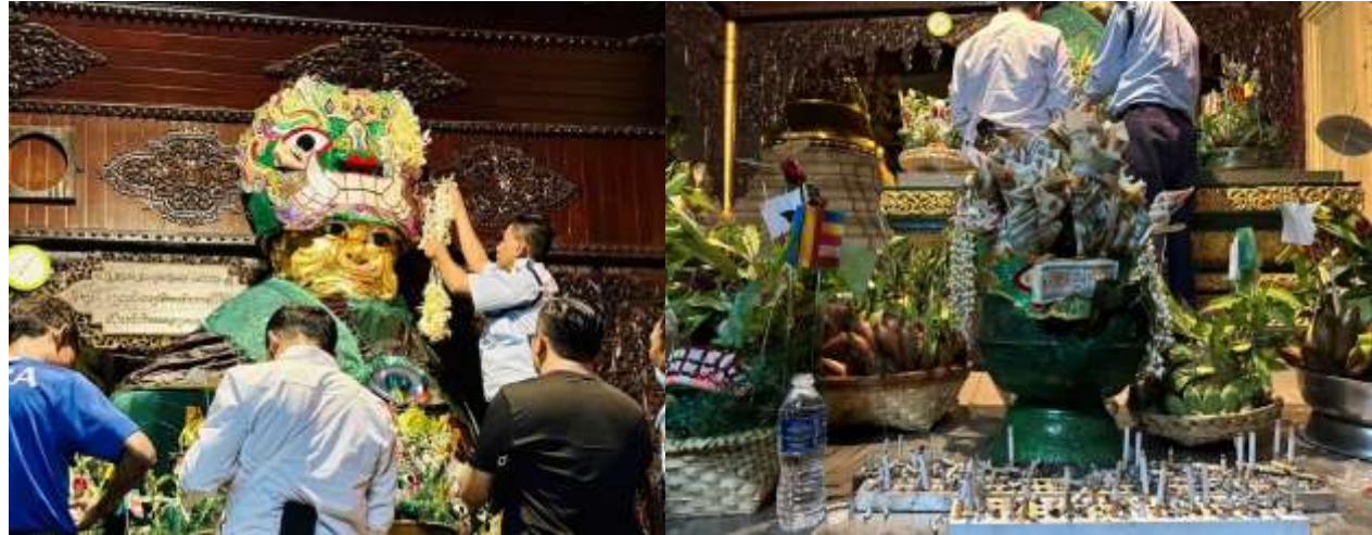
วิธีการขอพรจากแม่ยักษ์

พาท่านเดินไปขอพรที่ แม่ยักษ์ ผู้ปกป้องดูแลเจดีย์ คนพม่าเชื่อว่าแม่ยักษ์...จะช่วยในการตัดกรรมจากเจ้ากรรมนายเวร โดยเฉพาะอย่างยิ่งผู้ที่มีเวรกรรมกับเจ้ากรรมนายเวรทั้งหลายช่วยจัดเคราะห์กรรม ขจัดอุปสรรค ตัดขัดต่างๆ ความมาอธิษฐานขอให้ท่านช่วย ให้ชีวิตของคุณมีแต่ดีขึ้นเรื่อยๆ ซึ่งถ้าหากคุณกำลังมีทุกข์และหาหนทางไม่ออก ก็ลองมาไหว้ขอพรจะแม่ยักษ์ให้ช่วยบันดาลให้สิ่งร้ายๆ สิ่งไม่ดี ออกไปจากชีวิต และขอให้ชีวิตมีแต่สิ่งดีๆเข้ามา นอกจากนี้ยังเชื่อกันว่าแม่ยักษ์...ยังช่วยเรื่องความมีชื่อเสียงโด่งดัง เป็นที่รู้จักก้าวหน้าในหน้าที่การงาน ใครที่ตกงานอยู่ จุดนี้เป็นอีกหนึ่งจุดที่ต้องห้ามพลาด ปล.แม่ยักษ์จะประดิษฐานอยู่ติดกับบันไดประตูทางทิศตะวันออกค่ะ