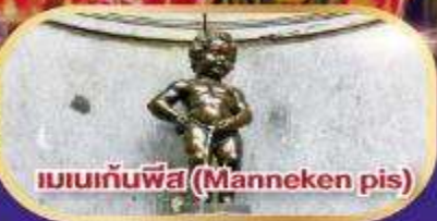
แมนเนกันพีส (Manneken pis)