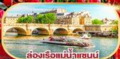
ล่องเรือแม่น้ำแซนน์