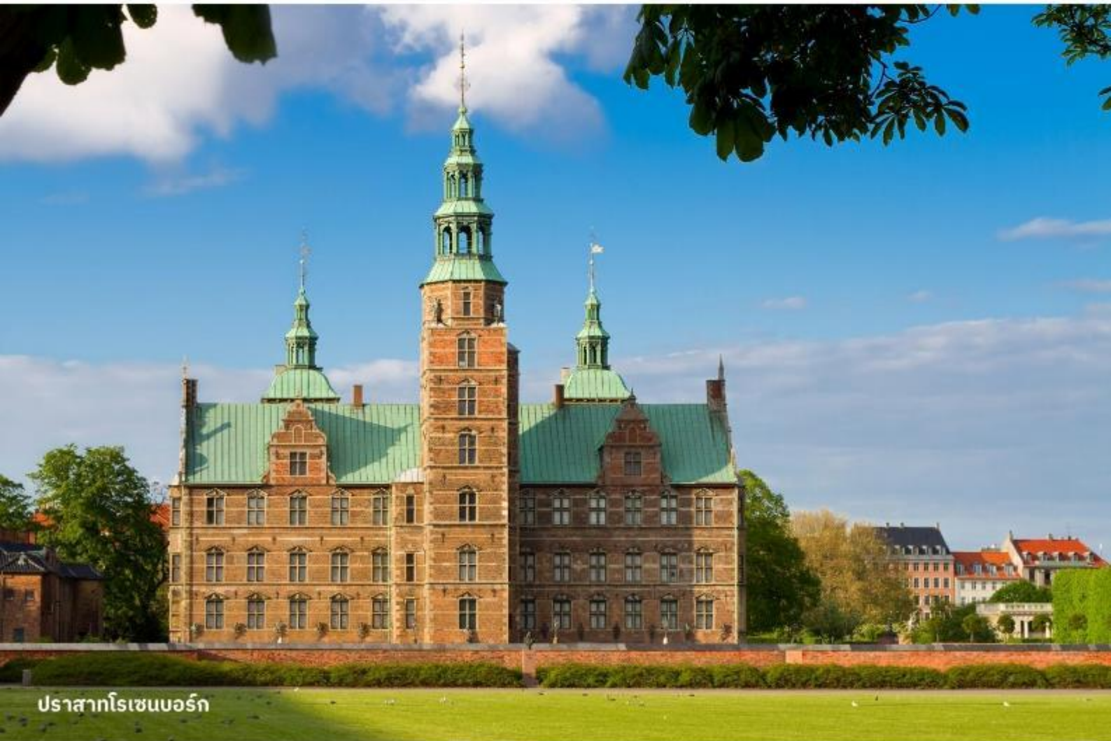
ปราสาทโรเซนบอร์ก

จากนั้นนำท่านเข้าชม ปราสาทโรเซนบอร์ก พระราชวังฤดูร้อนใจกลางเมืองโคเปนเฮเก้น เป็นพระราชวังที่มีอายุเก่าแก่กว่า 400 ปี โดยสถาปัตยกรรมของพระราชวังโรเซนเบิร์กนั้นได้รับอิทธิพลมาจากสถาปัตยกรรมรูปแบบเรอเนสซองส์ ซึ่งไฮไลท์สำคัญในการเข้าชมคือการชมเครื่องราชกกุธภัณฑ์ (The Crown Jewels) ของราชวงศ์เดนมาร์ก ซึ่งเป็นสมบัติล้ำค่าที่สุดที่จัดแสดงอยู่ที่นี่