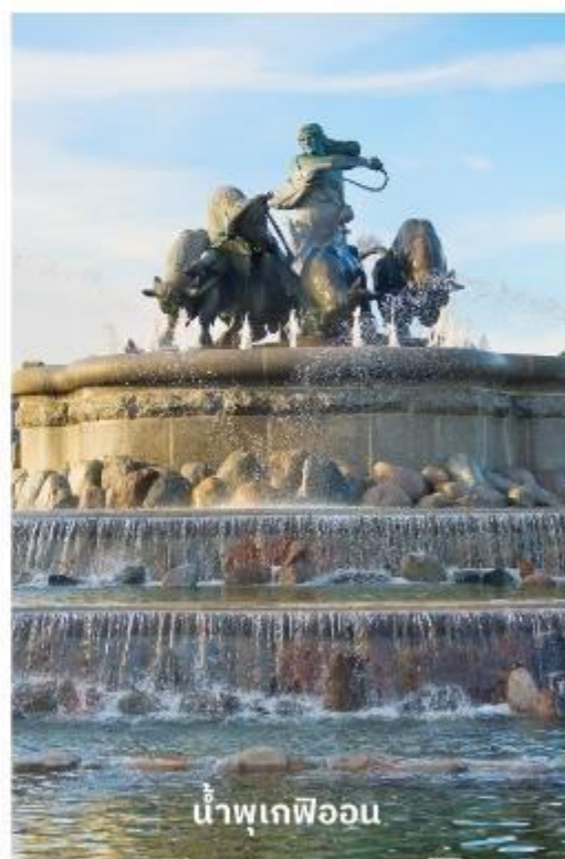
น้ำพุเกฟิออน