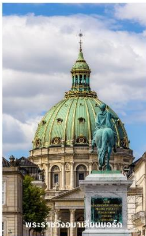
พระราชวังอมาเลียนบอร์ก