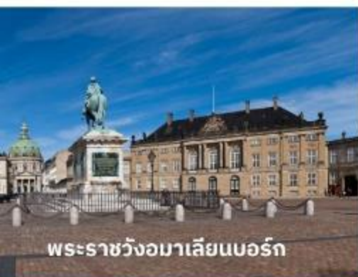
พระราชวังอมาเลียนบอร์ก