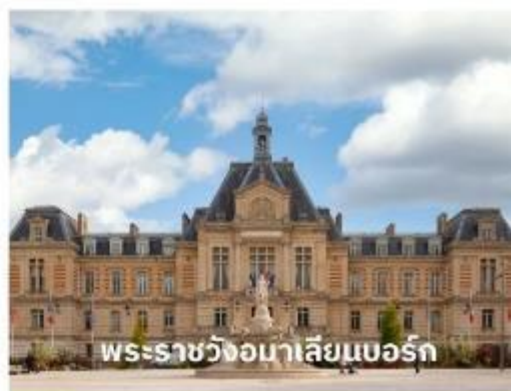
พระราชวังอมาเลียนบอร์ก