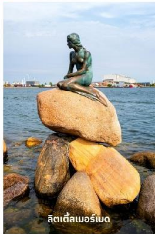
ลิตเติ้ลเมอร์เมด