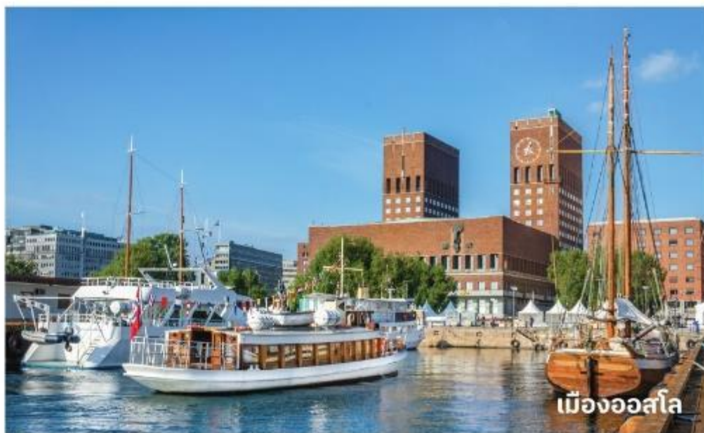
เมืองออสโล