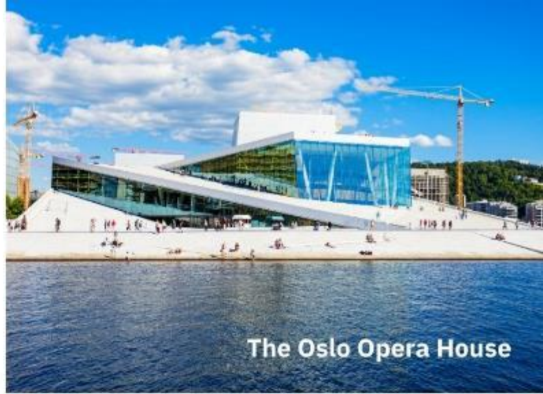
The Oslo Opera House

นำท่านเข้าสู่ที่พัก Scandic Helsfyr หรือเทียบเท่า