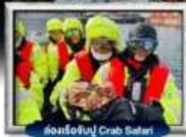
ส่องเรือจับปู Crab Safari