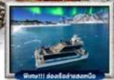
พิชิต!!! ส่องเรือสำแสงเหนือ

บินทรู สายการบิน Full Service | พิเศษ! ว่างปู King Crab