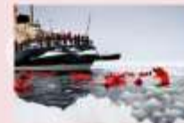
ล่องเรือตัดน้ำแข็ง Ice Breaker