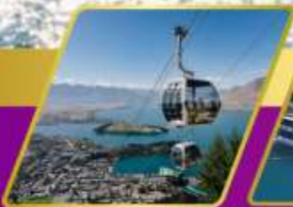
นั่งกระเช้ากอนโดล่า รับประทานอาหาร บนยอดเขานิวฟันพีค