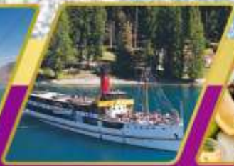
ล่องเรือกลไฟโบราณ อาหารแบบ BBQ ที่อัลเดอร์ฟิค ฟาร์ม