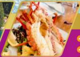
คุ้งมิงกร์ท่านละครั้งต่อ