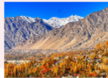
หุบเขาพาสสุ

** พักที่ Sarai Silk Route Hotel หรือเทียบเท่า **