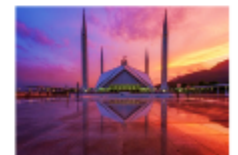
มัสยิดไฟซาล

19.30 น. นำท่านเดินทางสู่สนามบินอิสลามาบัด 23.20 น. ออกเดินทางสู่กรุงเทพ เที่ยวบิน TG350