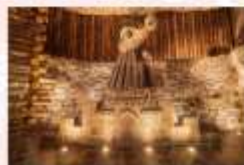
เหมืองเกลือวิลิชก้า