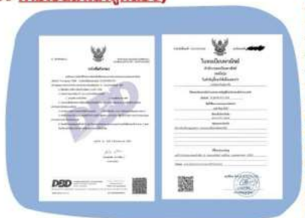
ตัวอย่างหนังสือจดทะเบียนบริษัทฯ และ ใบทะเบียนพาณิชย์