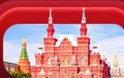
จัตุรัสแดง