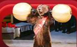
ชมละครสัตว์