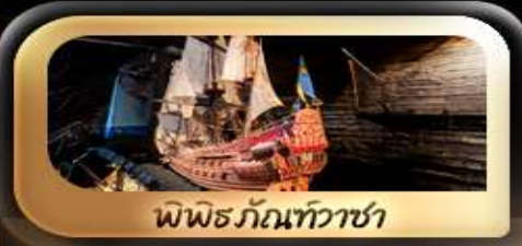
พิพิธภัณฑ์ทิวาชา