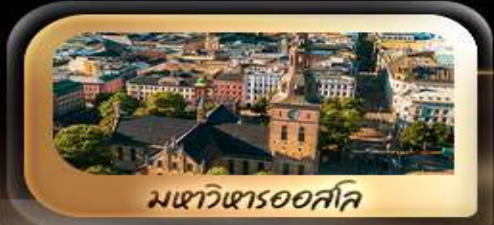
มหาวิหารออสโล