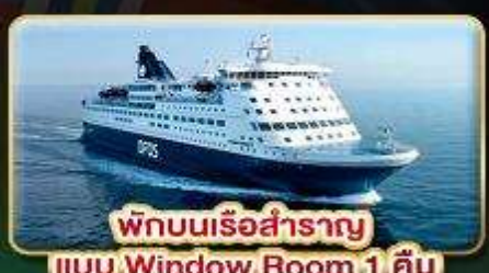
พักผ่อนเรือสำราญ แบบ Window Room 1 คืน

118,999.- ราคาเพียง เดินทางเทศกาลสงกรานต์ 11-19 เม.ย. 68