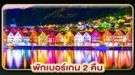
พักเบอร์เกน 2 คืน