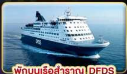
พักบนเรือสำราญ DFDS