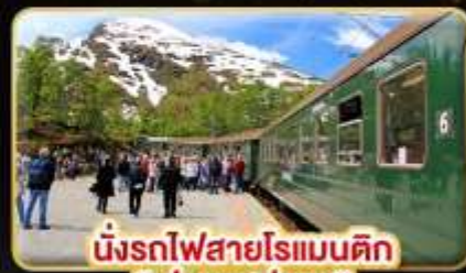
นั่งรถไฟสายโรแมนติก “ฟรอมสปาน่า”