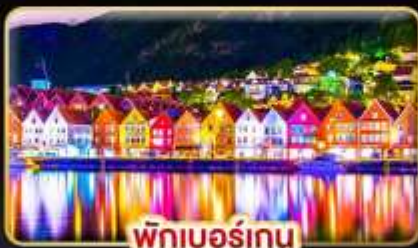
พักเบอร์เกน