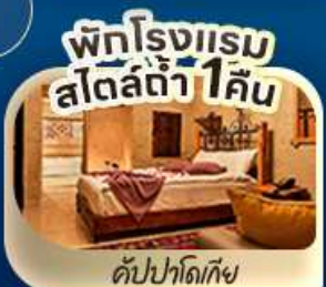
พักโรงแรม สโตร์ตี 1 คืน