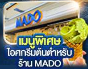
เมนูพิเศษ ไอศกรีมต้นตำหรับ ร้าน MADO