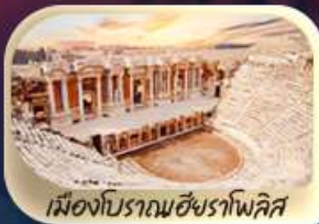
เมืองโบราณเฮียราโพลิส

ตุรกี อิสตันบูล ปามุกคาเล คัปปาโดเกีย อังการา