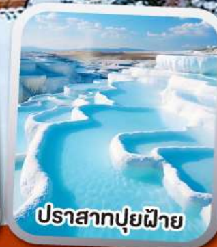
ปราสาทปุยฝาย