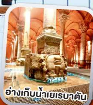
อ่างเก็บน้ำเยเรบาตัน