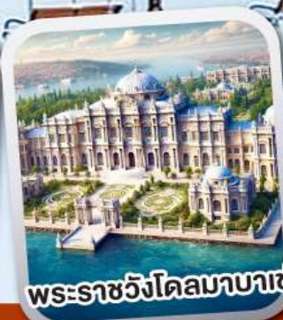
พระราชวังโดลมาบาเซ่